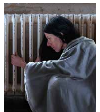
Das Motiv der SoVD-Kampagne.

Die Anmeldung ist offen und kostenfrei. Den Link zur Anmeldung finden Sie auf der Kampagnenseite unter www.sozialekaelte.de . Der erste Versand erfolgt bereits in Kürze.