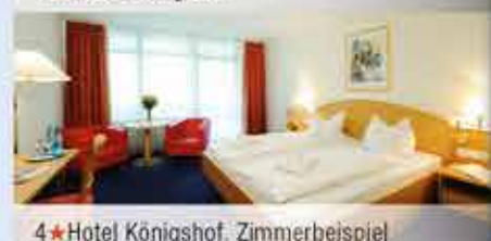
4★Hotel Königshof, Zimmerbeispiel