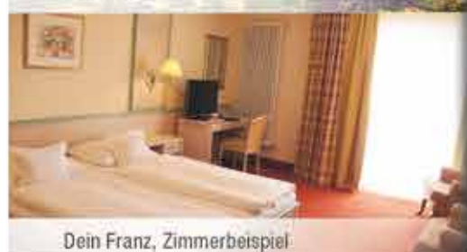
Dein Franz, Zimmerbeispiel